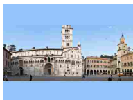
PIAZZA GRANDE (SITO UNESCO)