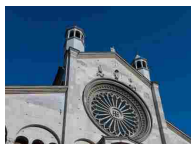
CATTEDRALE DI SANTA MARIA ASSUNTA E SAN GEMINIANO (DUOMO DI MODENA - SITO UNESCO)