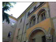
MUSEI DEL DUOMO DI MODENA